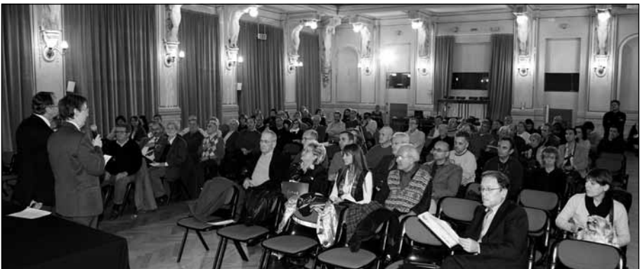
....durante l' 11° Seminario DIAF presso la Sala delle Cariatidi a Salsomaggiore.

Gli audiovisivi presentati per la partecipazione a questo Circuito devono essere liberi da ogni tipo di diritti di proprietà, artistiche od altri detenuti da terzi. Gli autori saranno in toto responsabili di questo. Ogni invio implica l'autorizzazione di proiezione pubblica degli audiovisivi purchè senza scopo di lucro da parte degli Organizzatori che si riservano comunque il diritto di scartare opere giudicate offensive o contrarie al buon costume ed alle disposizioni di legge in vigore.