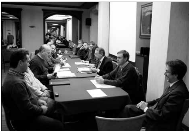
Salsomaggiore - Riunione preparatoria al 2° Circuito AV.