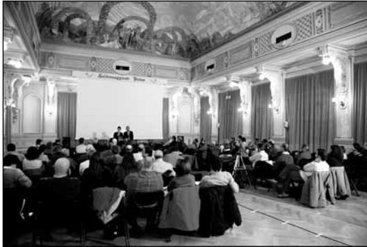
La Sala delle Cariatidi a Salsomaggiore, sede dell' 11° Seminario DIAF

Ciò non significa che il potenziale creativo del diaporama, in quanto arte, sia inferiore a quello di un film. L'estetica della pittura non ha avuto bisogno del movimento per esprimere gli aspetti della vita degli uomini.